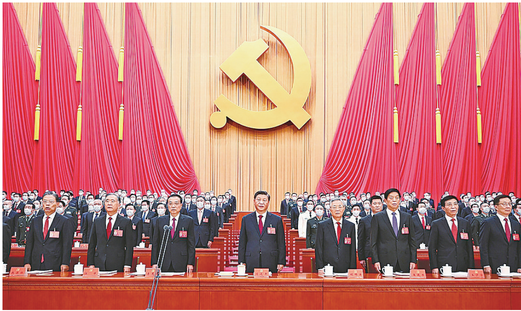
10月16日,中国共产党第二十次全国代表大会在北京人民大会堂开幕。习近平代表第十九届中央委员会向大会作报告。