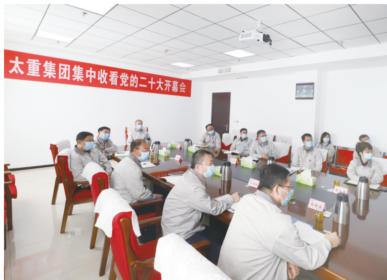
图为集团公司领导及相关单位负责人共同观看大会盛况

10月16日上午10时,中国共产党第二十次全国代表大会在北京人民大会堂隆重开幕。